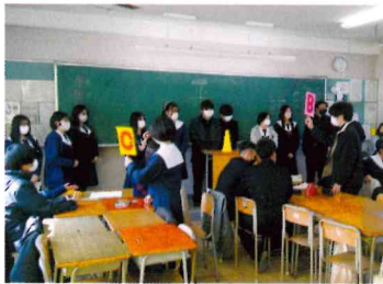
生徒主体で進む英語の授業中

文系 教えこむ授業ではなく、生徒が考える授業を展開 理系 日常生活に使える、生きた理系教育を実現