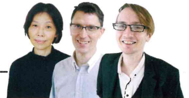
私たちが教えます!

2年生から類型別のカリキュラムに。国公立大学・私立大学等の進路選択に合わせて、自分で勉強したい科目を選べます