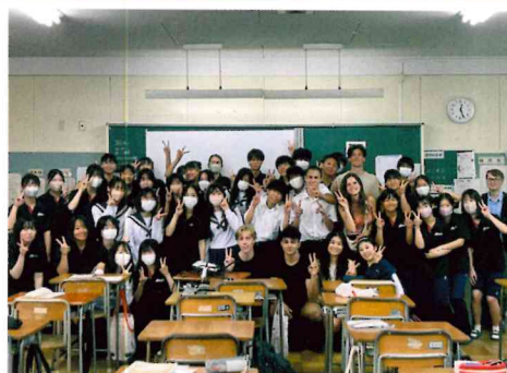
留学生との貴重な時間