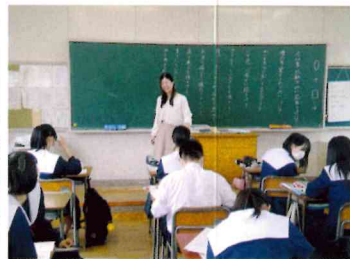
古文のなかの体言と用言を考えている生徒たち