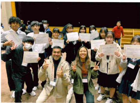
イングリッシュキャンプでは3日間英語づけ