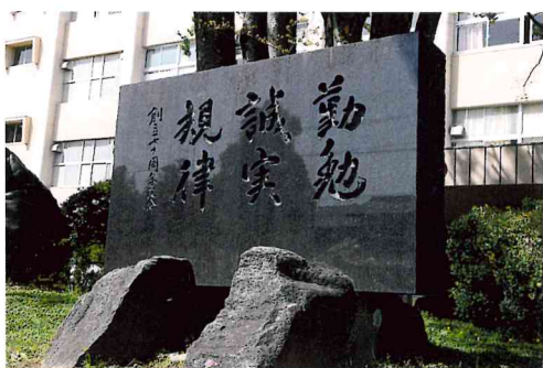
尾北の本館前庭にある校訓碑

自由で伸び伸びとした尾北高校の校風。その根幹をなすものが、この校訓です。生徒一人ひとりに宿る、自分の目標に向かって勉強を頑張ろうとする「勤勉」さ、他者に対して「誠実」であろうとする姿勢と「規律」を重んじる心が、現在の明るく穏やかな尾北高校を作っているのです。