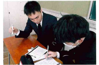
一人ひとりに面談し、一緒に進路を考えてくれる先生たち