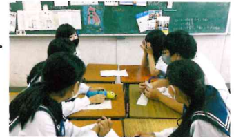
先進的な英語教育を推進

ネイティブの講師陣の授業が受けられるうえ、留学生を常に受け入れているため、生きた国際交流を日常的に体験できます。