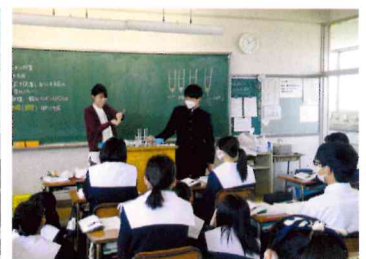
酵素の反応を見る実験中。リアルな体験が本物の知識に