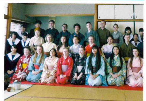
国際交流イベントの様子