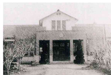
古知野町立古知野高等実践女学校