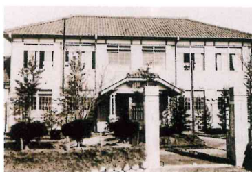
愛知県丹羽郡高等女学校