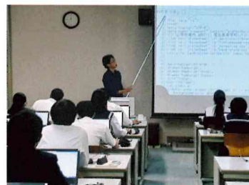
パソコンルームでHTML言語を学習中